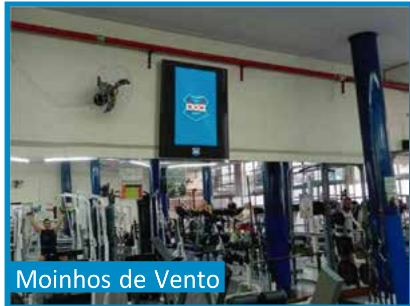
Moinhos de Vento