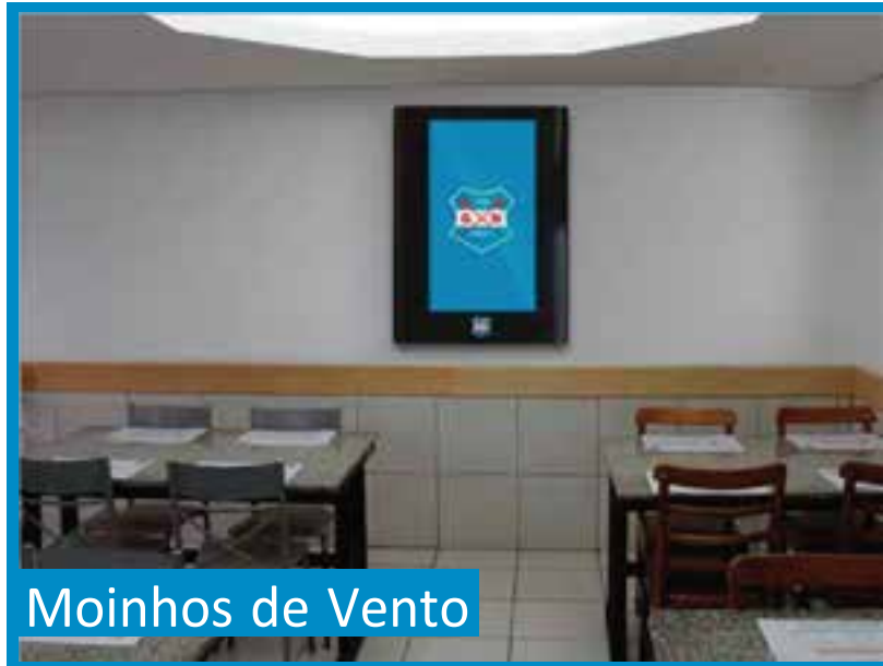
Moinhos de Vento